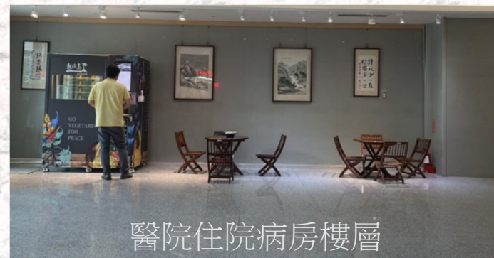
醫院住院病房樓層